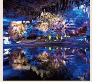
【十二背後雙河谷景區】

* 十二背後天坑浴場，天然「負氧離子康養聖地」。負氧離子除了能讓空氣清新外，對人體有多種保健作用，因此也被稱為“空氣維生素”和“長壽素”。