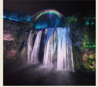
【夜遊黃果樹大瀑布】